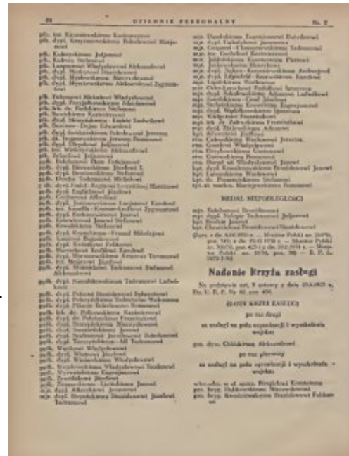
Pierwsze nadania, Dziennik Personalny str. nr 2

Odznaczenie zostało wznowione na mocy dekretu z 12 sierpnia 1954 r. Prezydenta RP na Obczyźnie Augusta Zaleskiego pod nieco zmienioną nazwą Krzyża i Medalu Niepodległości Polski Podziemnej.