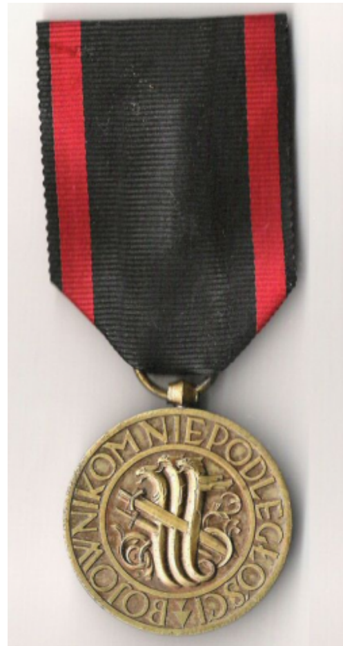
II Rzeczpospolita Polska 1918-1939, Medal Niepodległości