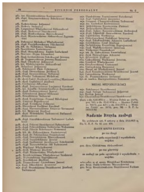
Pierwsze nadania, Dziennik Personalny str. nr 2

Odznaczenie zostało wznowione na mocy dekretu z 12 sierpnia 1954 r. Prezydenta RP na Obczyźnie Augusta Zaleskiego pod nieco zmienioną nazwą Krzyża i Medalu Niepodległości Polski Podziemnej.