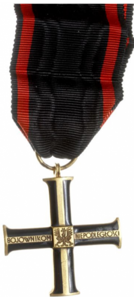
II Rzeczpospolita Polska 1918-1939, Krzyż Niepodległości