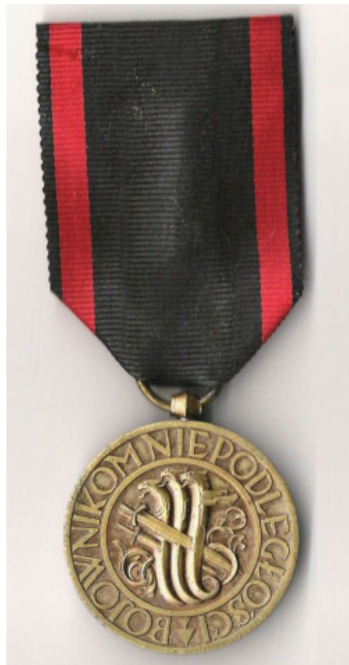
II Rzeczpospolita Polska 1918-1939, Medal Niepodległości