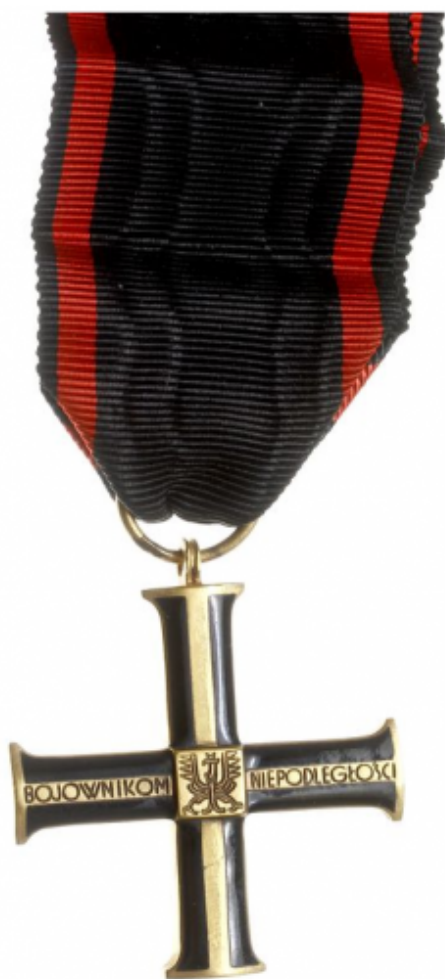
II Rzeczpospolita Polska 1918-1939, Krzyż Niepodległości