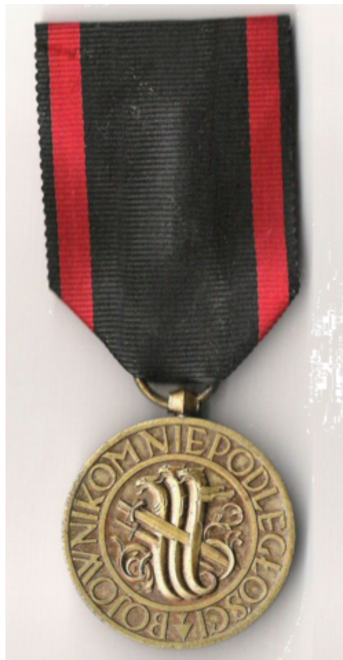
II Rzeczpospolita Polska 1918-1939, Medal Niepodległości