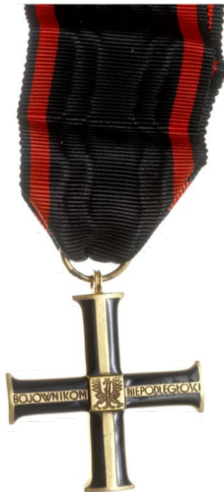
II Rzeczpospolita Polska 1918-1939, Krzyż Niepodległości