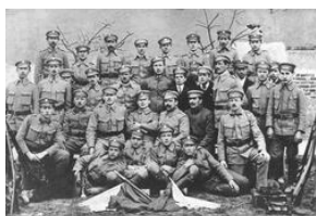
1913 Kraków (Nierozpoznani) Członkowie Związku Strzeleckiego