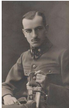
Zygmunt Karol Karwacki-CC BY-SA 3.0-Wikipedia

Warunki w jakich odbywał się kurs były twarde i surowe. Dzień zaczynał się o 6 rano, o 8 zaczynały się ćwiczenia, a od 10 wykłady. Ćwiczenia taktyczne odbywały się na wschodnim zboczu Śnieżnicy i Ćwilina oraz między masywami Łopienia i Mogielicy na ich zachodnich zboczach, na terenie wsi Chyszówki. Szkolenie obejmowało wykłady i zajęcia praktyczne, a ich