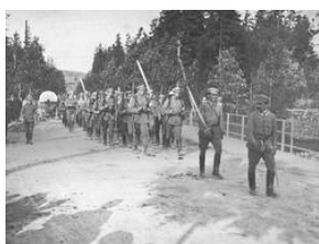
Związek Strzelecki --- ćwiczenia w Zakopanem 1913. 1- H-154-3