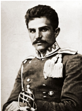
Władysław Belina-Prażmowski Fot. NAC Sygn. 1-H-112