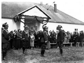
Uroczystość odsłonięcia tablicy pamiątkowej 20-lecie Szkoły Strzeleckiej w Stróży

W 1920 roku Ludwik Lazar, ostatni właściciel Stróży, rozparcelował majątek i przeznaczył budynek dworu na szkołę. Pierwotnie był to parterowy budynek, później rozbudowano go poprzez podwyższenie dachu i utworzenie sal na piętrze. Usytuowane centralnie wejście do dworu pozostało bez zmian - ganek z dwoma kolumnami.