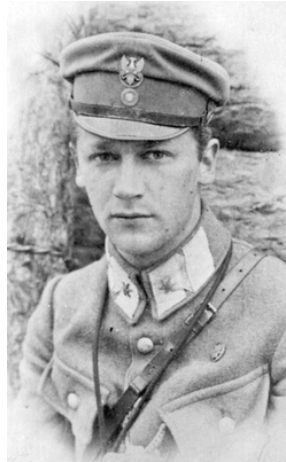
Tadeusz Wyrwa-Furgalski-Domena publiczna -Wikipedia