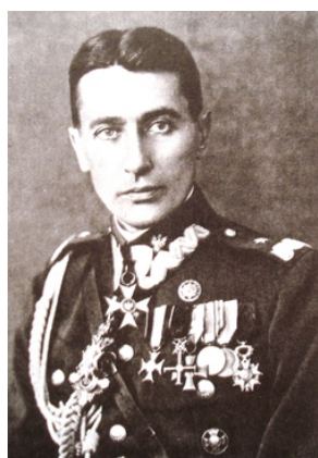
Julian_Stachiewicz_1939-Domena publiczna -Wikipedia