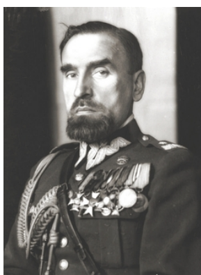
Kordian_Zamorski_1935-Domena publiczna -Wikipedia