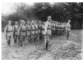
Kurs szkoły oficerskiej Związku Strzeleckiego w Stróży -sierpień 1918. Sygn. 22-101