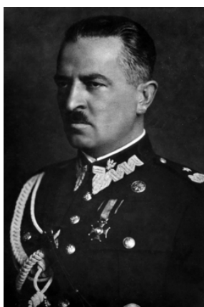
Janusz_Głuchowski_1938-Domena publiczna -Wikipedia