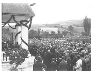
Uroczystość odsłonięcia tablicy pamiątkowej 20-lecie Szkoły Strzeleckiej w Stróży-NAC, Sygn.1-N-1763a-13