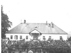
Uroczystość odsłonięcia tablicy pamiątkowej 20-lecie Szkoły Strzeleckiej w Stróży-NAC, Sygn.1-N-1763a-16