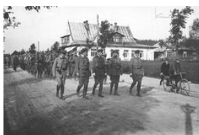
Związek Strzelecki -- ćwiczenia w Zakopanem 1913. Fot. NAC. Sygn. 1- H-154-2