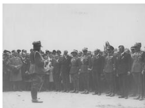
Uroczystość odsłonięcia tablicy pamiątkowej 20-lecie Szkoły Strzeleckiej w Stróży-NAC, Sygn. 1-N-1763a-8