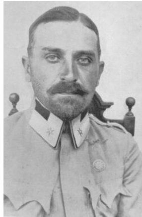
Ottokar_Brzoza-Brzezina przed 1915