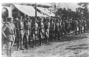
Ćwiczenia Związku Strzeleckiego w Zakopanem-- 19-22.08.1913 +.