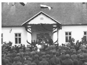
Uroczystość odsłonięcia tablicy pamiątkowej 20-lecie Szkoły Strzeleckiej w Stróży-NAC, Sygn.1-N-1763a-17

8 października 1933 roku w dwudziestą rocznicę powstania Pierwszej Oficerskiej Szkoły Strzeleckiej w Stróży na budynku szkoły została wmurowana pamiątkowa tablica. Na uroczystość przybyło dużo gości i liczna grupa absolwentów szkoły. Na tablicy, oprócz orła strzeleckiego, umieszczono następującą inskrypcję: