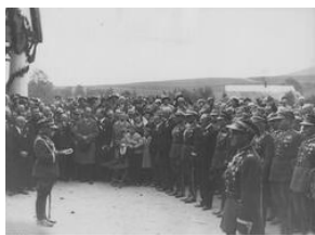
Uroczystość odsłonięcia tablicy pamiątkowej 20-lecie Szkoły Strzeleckiej w Stróży-NAC, Sygn. 1-N-1763a-7