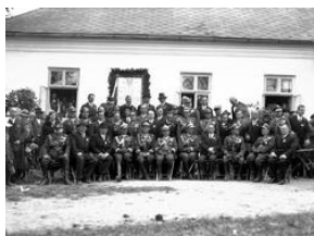
Uroczystość odsłonięcia tablicy pamiątkowej 20-lecie Szkoły Strzeleckiej w Stróży-NAC, Sygn.1-N-1763a-10