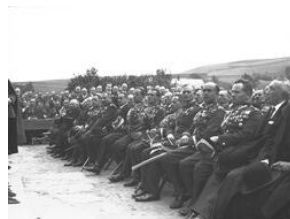
Uroczystość odsłonięcia tablicy pamiątkowej 20-lecie Szkoły Strzeleckiej w Stróży