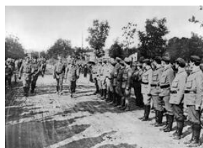
Ćwiczenia Związku Strzeleckiego w Zakopanem-- 19-22.08.1913 +.