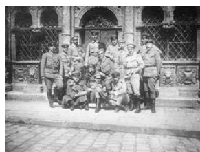
1914 czerwiec Kraków Rada Główna Związku Walki Czynnej Sygn. 22-97-2