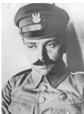
Mieczysław-Rys-Trojanowski-Domena publiczna -Wikipedia