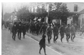
Ćwiczenia Związku Strzeleckiego w Zakopanem-- 19-22.08.1913 +.