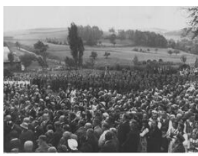
Uroczystość odsłonięcia tablicy pamiątkowej 20-lecie Szkoły Strzeleckiej w Stróży-NAC, Sygn.1-N-1763a-14