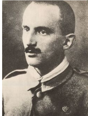
Stanisław Krynicki (1) 1914