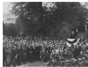
Uroczystość odsłonięcia tablicy pamiątkowej 20-lecie Szkoły Strzeleckiej w Stróży- NAC, Sygn.1-N-1763a-9