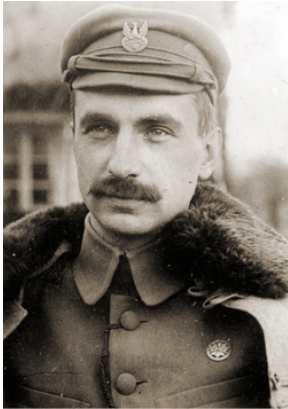
Sosnkowski 1915