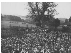
Uroczystość odsłonięcia tablicy pamiątkowej 20-lecie Szkoły Strzeleckiej w Stróży-NAC, Sygn.1-N-1763a-15