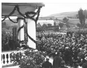
Uroczystość odsłonięcia tablicy pamiątkowej 20-lecie Szkoły Strzeleckiej w Stróży-NAC, Sygn.1-N-1763a-11