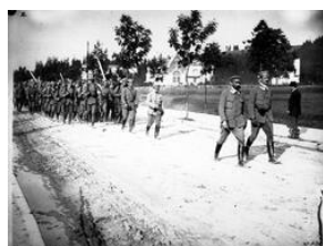
Związek Strzelecki - ćwiczenia w Zakopanem 1913. Sygn. 1- H-154-1